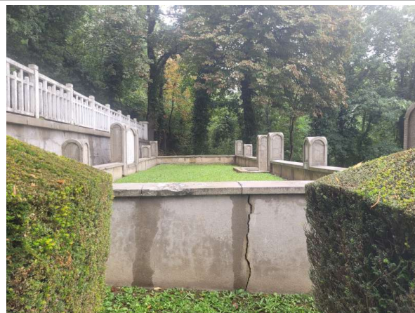
Prélèvement - P2 : OSSUAIRES - Enduit- (Absence d'amiante)