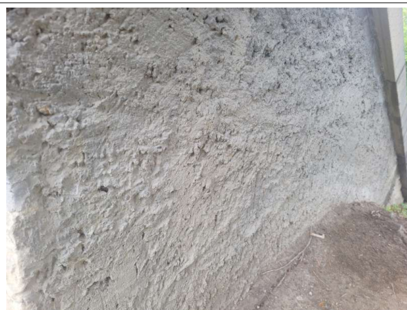
Prélèvement - P6 : ACCES PRINCIPAL - Enduit- (Absence d'amiante)