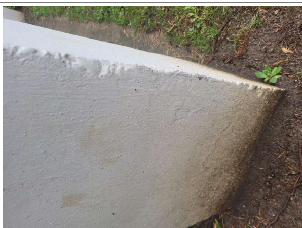
Prélèvement - P5 : ACCES SECONDAIRE - Enduit- (Absence d'amiante)