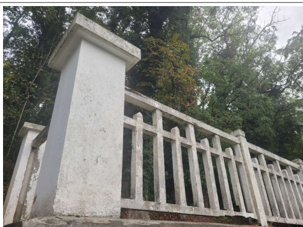
Prélèvement - P3 : OSSUAIRES - Enduit- (Absence d'amiante)