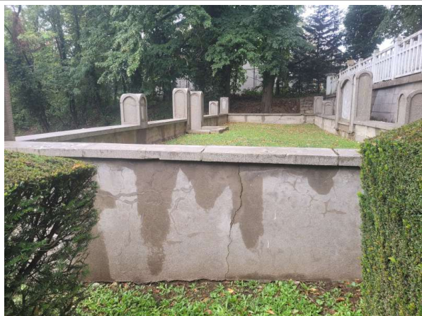
Prélèvement - P1 : OSSUAIRES - Enduit- (Absence d'amiante)