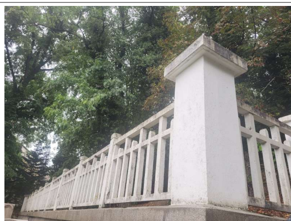
Prélèvement - P4 : OSSUAIRES - Enduit- (Absence d'amiante)