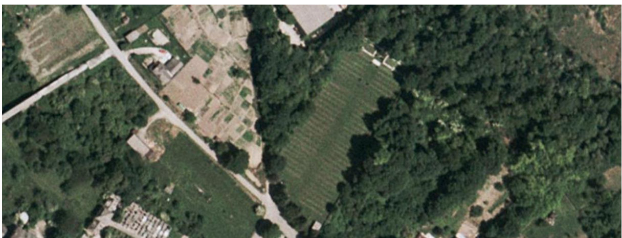
Nécropole nationale d'Altkirch

Réparation ou reconstruction à l'identique